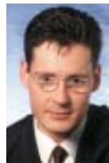
Keynote Speaker zu Voice Portale

Ihre Kunden erwarten heute beim Self-Service mit Sprache sicher mehr als DTMF-Tastentöne. Ihr Kunde will Informationen schnell und einfach jederzeit abrufen ohne sich durch umständliche Menüstrukturen zu hangeln. Das Clarity Sprachportal bietet Ihnen und Ihren Kunden natürlich-sprachlichen, einfachen und schnellen Self-Service. Der Freiraum Ihrer Kunden bei der Kommunikation mit dem Clarity Sprachportal ist natürlich und stellt das gewünschte Ergebnis sicher.