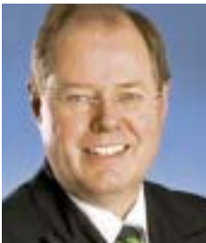
Peer Steinbrück Ministerpräsident des Landes Nordrhein-Westfalen

"... Unternehmen stehen für ein gebündeltes Know-how in allen Bereichen der TIMES-Branche. Der Mittelstand gilt dabei zu Recht als Motor für Wachstum und Beschäftigung, Qualifikation und Innovation und ist für die Erneuerung und Modernisierung der Wirtschaft in NRW von herausragender Bedeutung..."