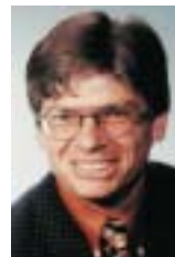
Keynote Speaker zu Voice Commerce

WebSphere Everyplace Access ist IBM's offene Plattform für das mobile e-business und unterstützt den zeitnahen Zugriff auf geschäftskritische Anwendungen