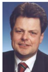
Keynote Speaker zu Information Liquidity

Sybase ist führender Anbieter von Software, die unterschiedliche IT-Plattformen, Datenbanken und Anwendungen integriert. Sybase-Lösungen schaffen Infor-