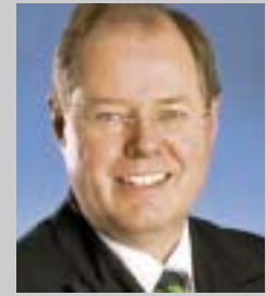
Peer Steinbrück Ministerpräsident des Landes Nordrhein-Westfalen

„Das Medienland Nordrhein-Westfalen wird geprägt von den individuellen Stärken seiner Regionen. Düsseldorf hat sich dabei als Sitz von über tausend Unternehmen der Medien-, Telekommunikations- und Werbebranche einen Namen gemacht. In kaum einem anderen Bundesland ist das Wachstum der Medienwirtschaft so stark und nachhaltig zu spüren wie hier. NRW hat als zukunftsfähiger Medienstandort beste Voraussetzungen. In der Medienwirtschaft des Landes arbeiten derzeit mehr als 365.000 Beschäftigte. Sie hat sich mit ihrer Vielfalt von Produkten und Dienstleistungen zu einem zentralen Wachstumsträger entwickelt, dessen Potenziale noch lange nicht ausgeschöpft sind. Dennoch gehört Nordrhein-Westfalen schon heute zu den führenden Medienstandorten in Europa. Wirtschaftsprognosen gehen davon aus, dass in den nächsten drei Jahren bundesweit 350.000 neue Arbeitsplätze in der Software-Branche, der Multimediaproduktion und in den eBusiness-Anwenderbranchen entstehen. Die Chance, einen erheblichen Teil dieser neuen Arbeitsplätze in NRW anzusiedeln, ist groß. Unsere Unternehmen stehen für ein gebündeltes Know-how in allen Bereichen der TIMES-Branche. Der Mittelstand gilt dabei zu Recht als Motor für Wachstum und Beschäftigung, Qualifikation und Innovation und ist für die Erneuerung und Modernisierung der Wirtschaft in NRW von herausragender Bedeutung. Überzeugen Sie sich bei einem Besuch der ONLINE 2003 von der Innovationskraft unseres Landes NRW und seiner Unternehmen.“