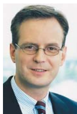
Keynote Speaker zu eCRM

Sapiient ist eine führende Management- und Technologie-Beratung, die ihre Kunden bei Entwicklung und Support fortschrittlicher Technologien zur Erreichung messbarer Geschäftsergebnisse unterstützt. Hierzu verknüpft Sapiient ein umfassendes Leistungsangebot mit einem integrierten Projektmanagement und bietet Projekte auf Festpreis- und Festlaufzeitbasis an. Wir bieten Lösungen in den Bereichen Application Development / Package Integration, Enterprise Architecture, Customer Relationship Management, Supply Chain Management und Knowledge Manage-