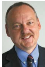
Keynote Speaker zu WLAN

Zukunftsorientierte Breitbandkommunikation Die Kölner QSC AG betreibt eines der modernsten DSL-Netze (Digital Subscriber Line) in Deutschland. QSC steht für "Quality", "Service" und "Communication". Das Unternehmen verfügt über eine differenzierte Produktpalette für Geschäftskunden, Reseller und anspruchsvolle Privatkunden. Zusätzlich bietet QSC durch den